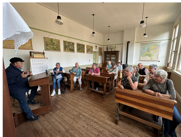
Boeren- bonds- museum 19/09