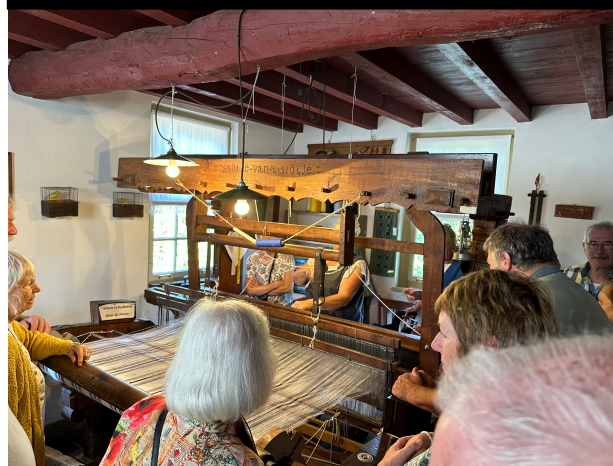
Boeren- bonds- museum 19/09