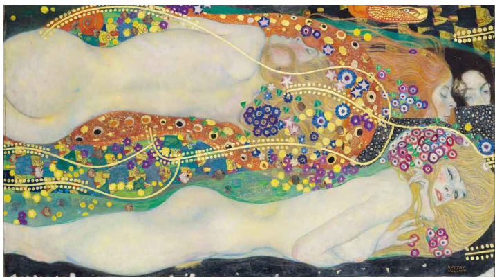
Gustav Klimt, Waterslangen II, 1904/1906-07

verrassende inzichten oplevert! Onze bijeenkomsten vinden plaats op donderdagochtend van 10.30 tot 12.00 uur.