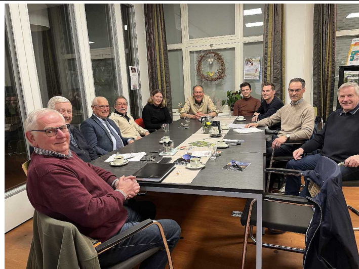
afvaardiging v. h. SG bestuur en het bestuur v.h. CDA

Op 27 maart heeft een vertegenwoordiging van het bestuur van Senioren Gennep een overleg gehad met afgevaardigden van het CDA. In dit overleg zijn diverse thema's aan de orde gekomen. Een belangrijk onderwerp was de aandacht voor eenzaamheid en armoede onder senioren. Om deze reden is Senioren Gennep ook vertegenwoordigd in een werkgroep van de gemeente zodat we op dit terrein onze inbreng kunnen leveren. "WOZO" (Wonen, Ondersteunen en Zorg voor Ouderen) is steeds relevanter voor senioren en verdient extra aandacht. Wij als Seniorenorganisatie vinden het belangrijk serieus genomen en gehoord te worden op dit gebied. Beide partijen waren tevreden over dit overleg en stellen voor om het jaarlijks te herhalen. Daarnaast is de afspraak gemaakt om direct overleg te voeren als daar aanleiding toe is.